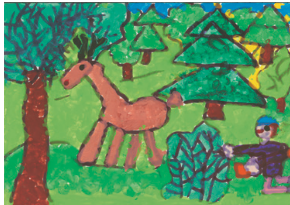
Наталия К., 6-годишна.