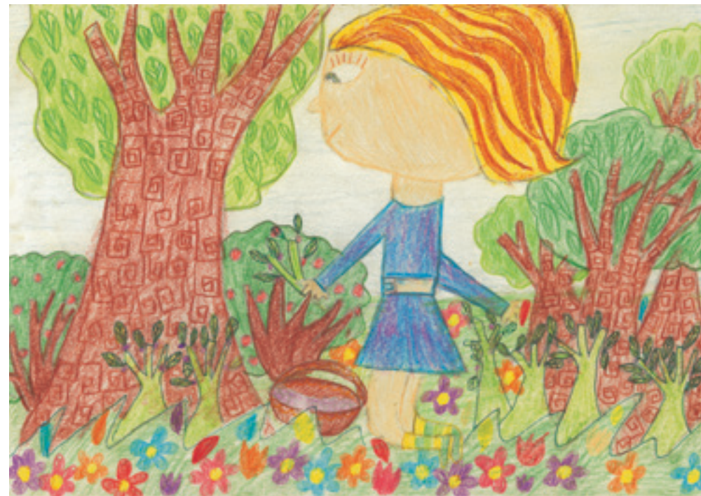
Года Д., 8-годишна.