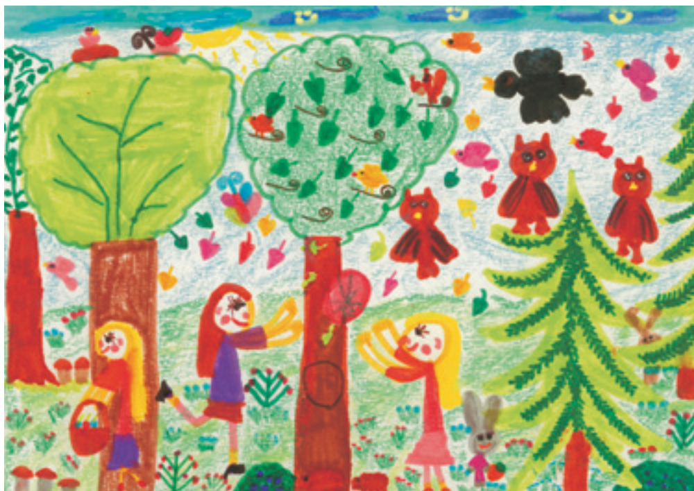
Угне М., 6-годишна.