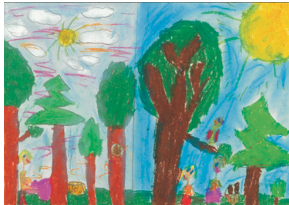
Наталка Д., 7-годишна.