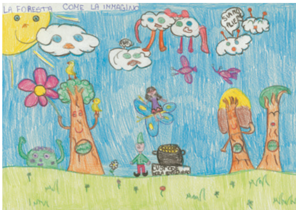
Франческа М., 4-ти клас.