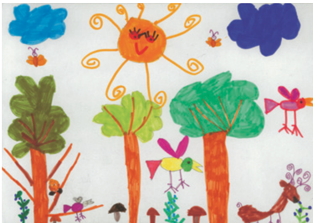
Скайсте Д., 6-годишна.