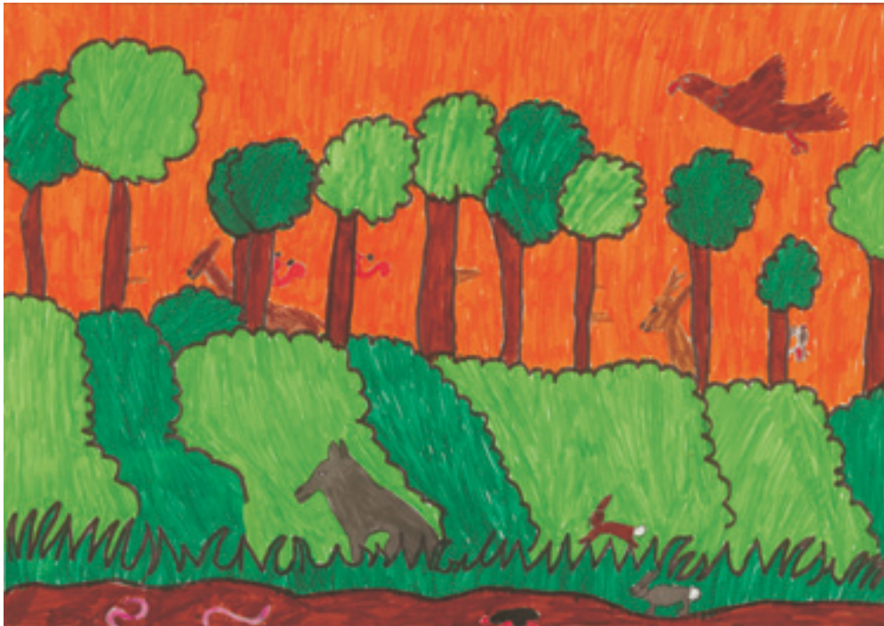
Виолет Б., 8-годишна.