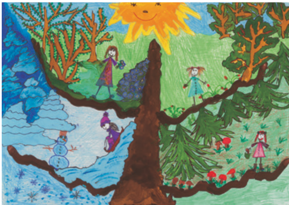
Густе Р., 7-годишна.