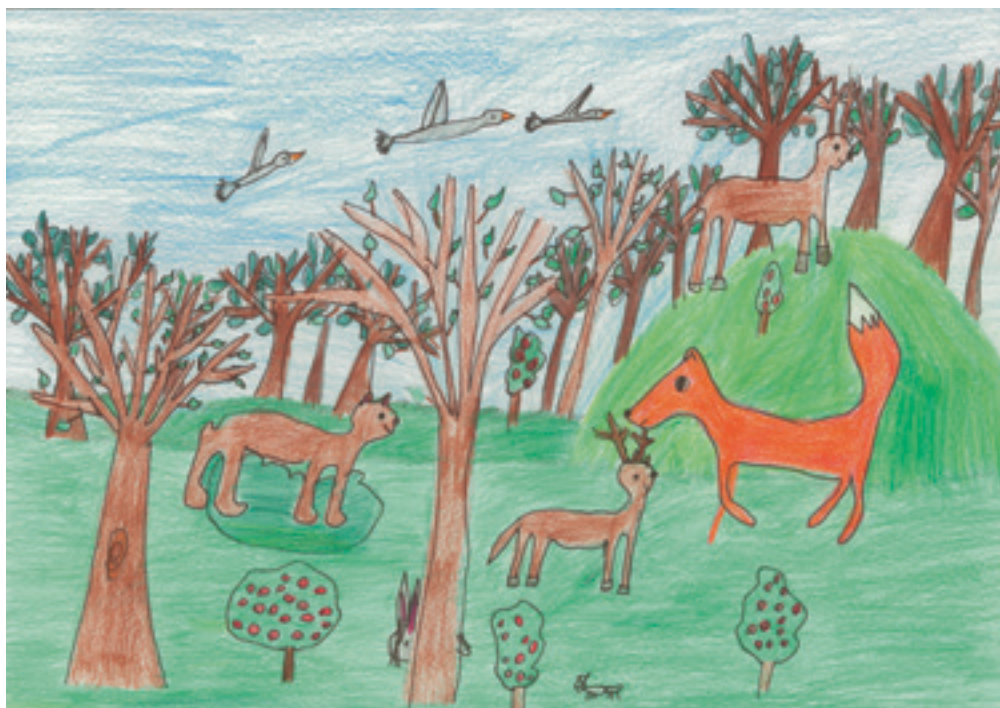
Синтия С., 9-годишна.