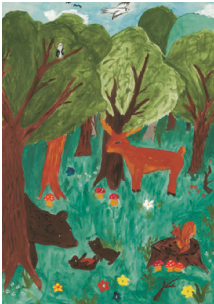
Якоб С., 10-годишен.