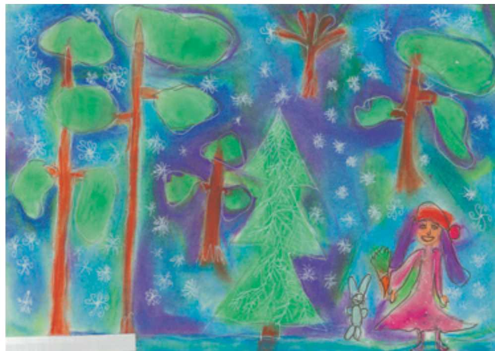
Русне М., 7-годишна.