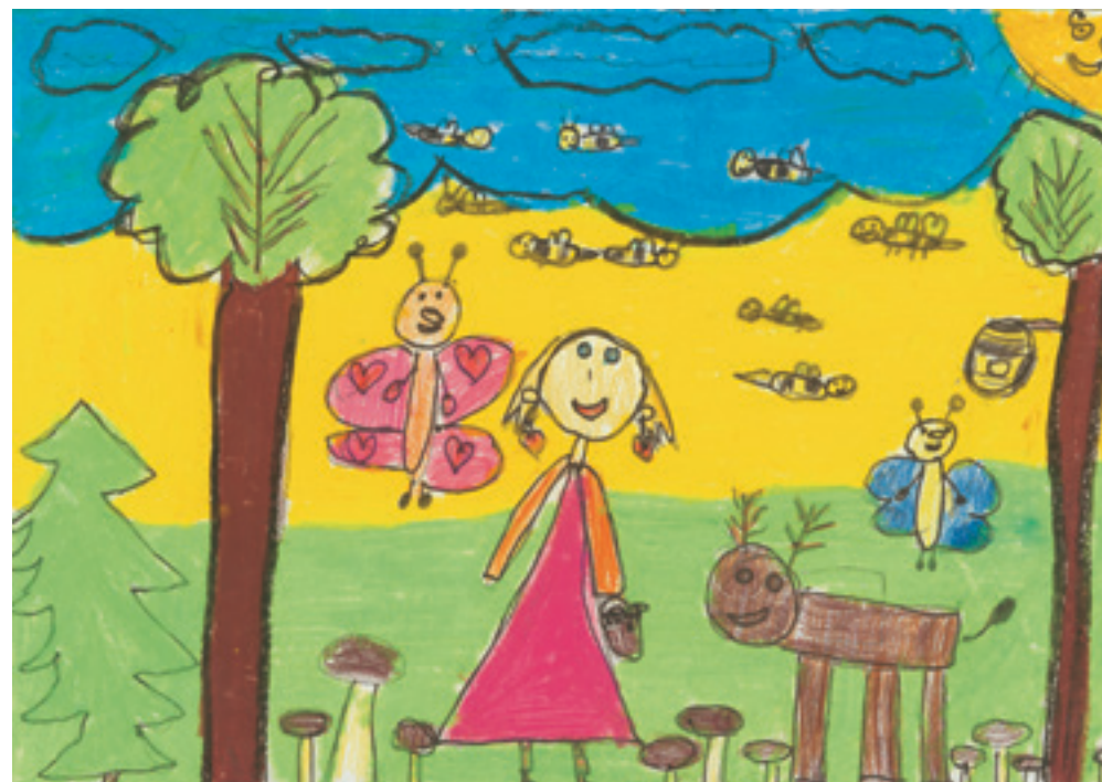
Виктория Я., 6-годишна.