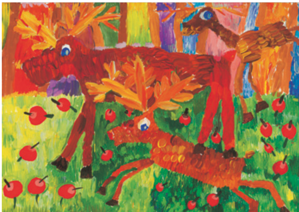
Габриеле Д., 10-годишна.